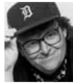
Michael Moore contre George Bush: Le bon et le méchant