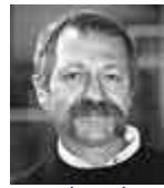
José Bové: Pour une logique de la diversité alimentaire